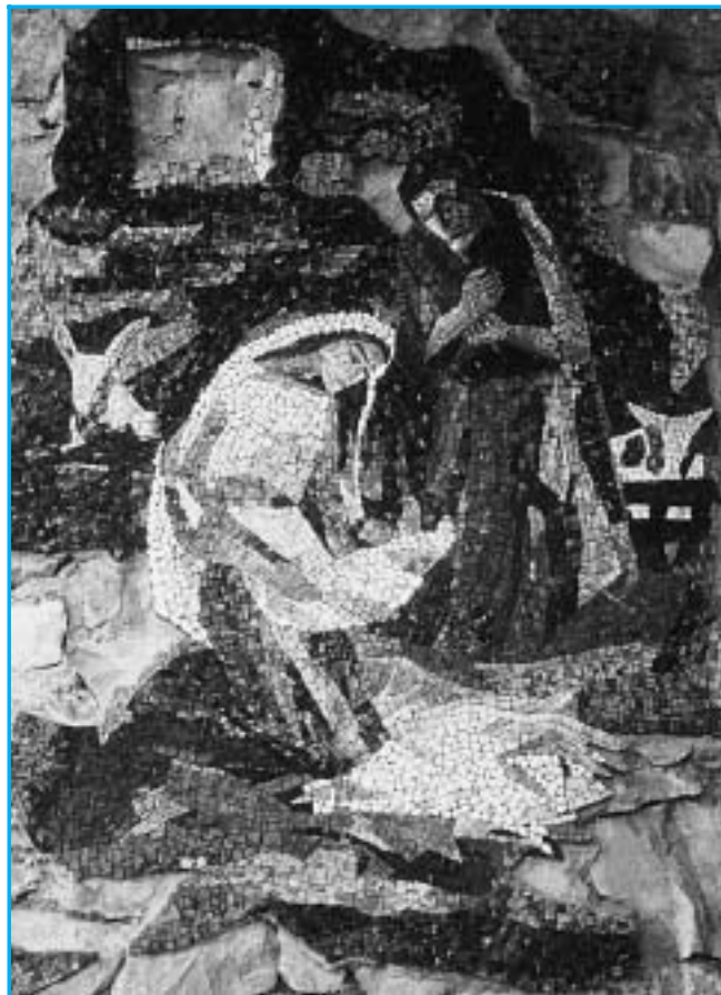
Mosaico del Natale nella terza cappella del Rosario.