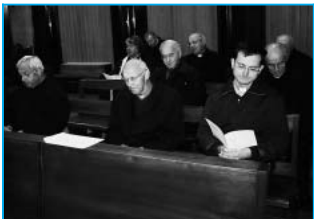
Preti delle foranie di Belluno e Sedico in ritiro al Santuario.