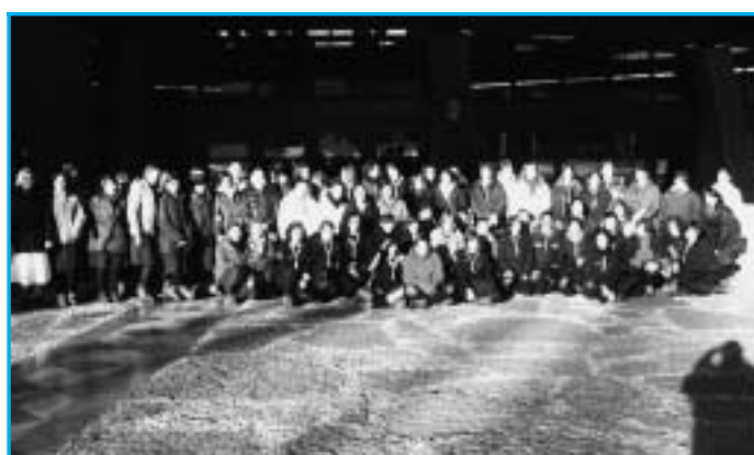
Le scolte di Belluno degli scout d'Europa in sosta di spiritualità al Santuario.