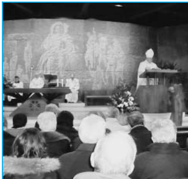
Mons. Silvio Padoin, vescovo emerito di Pozzuoli, celebra in Santuario la Messa solenne dell'Immacolata, a conclusione del 150 mo delle apparizioni di Lourdes.

Segnala la presenza di una Parola, che va ascoltata nel silenzio e lasciata risuonare nel cuore, perché germogli come pianta di primavera e produca frutti maturi di vita nuova. "Cercate anzitutto il regno di Dio e la sua giustizia" dice Gesù nel Vangelo (Mt 6,33).